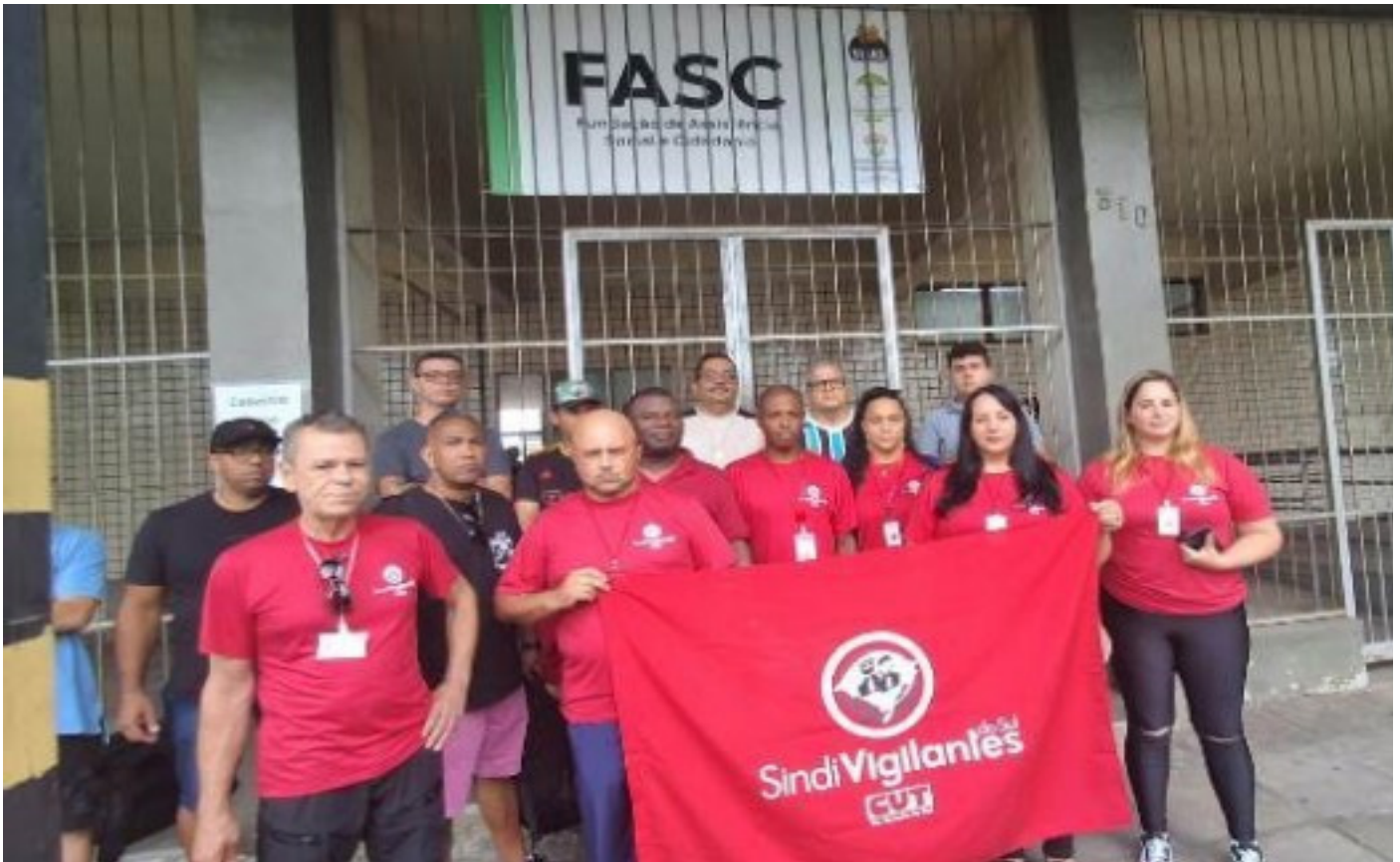
Reunião foi na sede da Fasc

Numa reunião na manhã desta sexta-feira (24), a direção da Fundação de Assistência Social e Cidadania (Fasc) anunciou que está ingressando com ação judicial a fim de garantir o pagamento dos salários dos vigilantes da VM Vigilância e Segurança. Estavam presentes diversos trabalhadores da empresa que ainda não receberam em janeiro e uma comissão do Sindivigilantes do Sul.