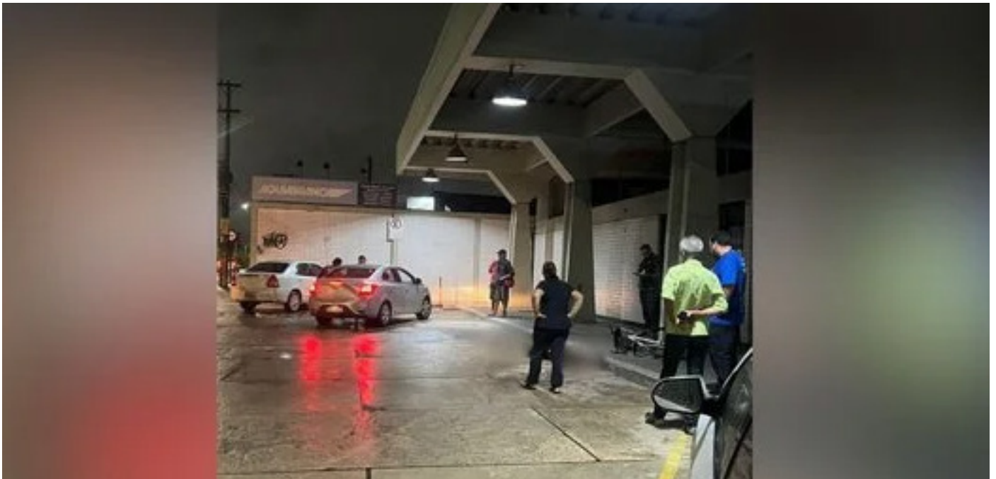
PM mata suspeito de roubo na Serra.

Segundo PM, vigilante contou que homem apontou arma em sua direção, por isso ele atirou; posteriormente foi identificado que se tratava de simulacro