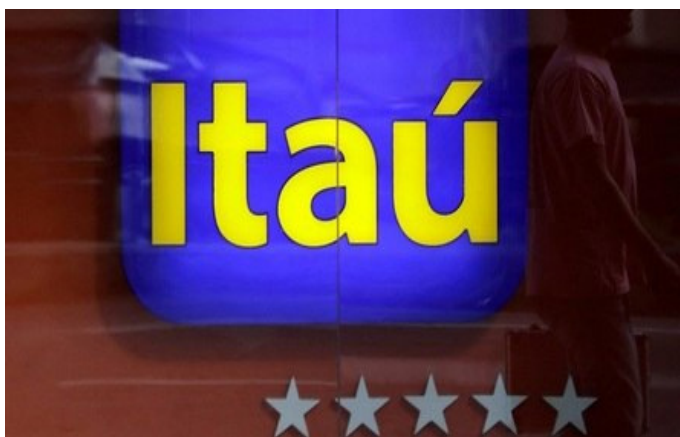
Fachada de agência do banco Itaú no Rio de Janeiro SERGIO MORAES / REUTERS - 29/4/2019

Decisão foi anunciada nesta quinta (24) em fato relevante; atendimento a clientes do país será feito nas unidades internacionais