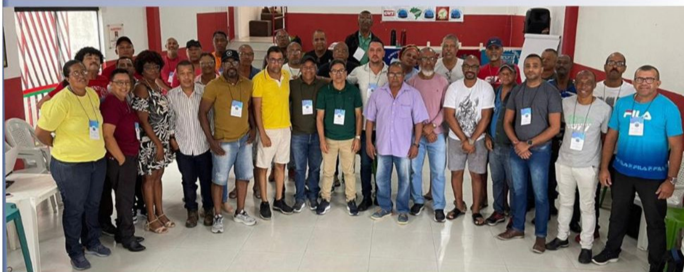
Presidentes, Diretores e Delegados, presentes no seminário, realizado em Camaçari.