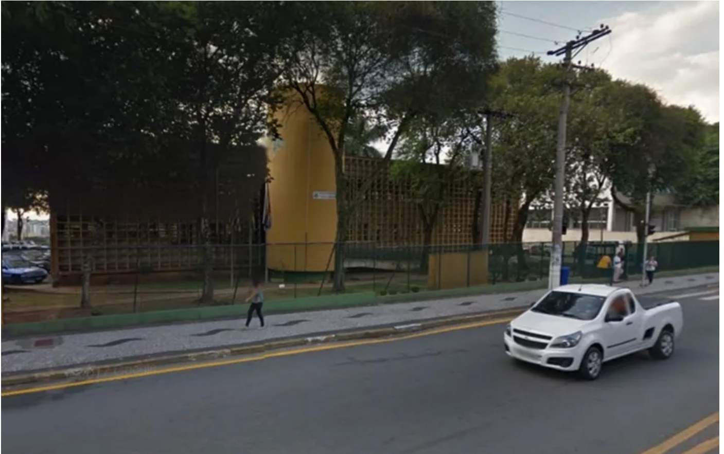
Fórum de Diadema, que foi alvo de assalto no sábado (17)

Quase 400 armas foram roubadas do Fórum de Diadema, na Grande São Paulo, na noite deste sábado (17), segundo a Secretaria de Segurança Pública de São Paulo.