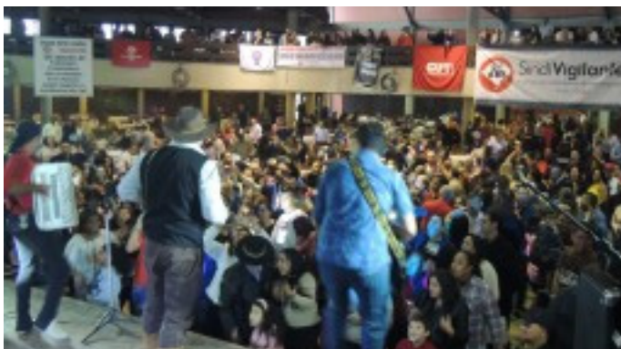
Baile durou a tarde toda, até início da noite

quero agradecer ao nosso corpo jurídico, que foi fundamental para nossa posse”, acrescentou.