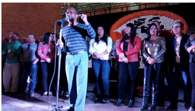
Boaventura falou sobre a importância da categoria e o reconhecimento com o Dia Nacional do Vigilante

Festa com Tchê Barbaridade e Bambas lotou a Casa do Gaúcho