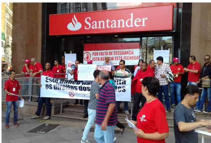
Agência Centenária e mais duas ficaram fechadas até o meio-dia

A direção e apoios do Sindivigilantes do Sul, com a participação de dirigentes da CUT, fecharam três agências do banco Santander, na manhã desta segunda-feira (21), no centro de Porto Alegre, em protesto contra a determinação do banco que proíbe os vigilantes de almoçarem, desde setembro. Foram impedidas de abrir para os clientes, permanecendo fechadas até o meio-dia, as agências Centenário e mais duas filiais localizadas na Rua Sete de Setembro, na quadra entre a Praça da Alfândega e a Prefeitura.