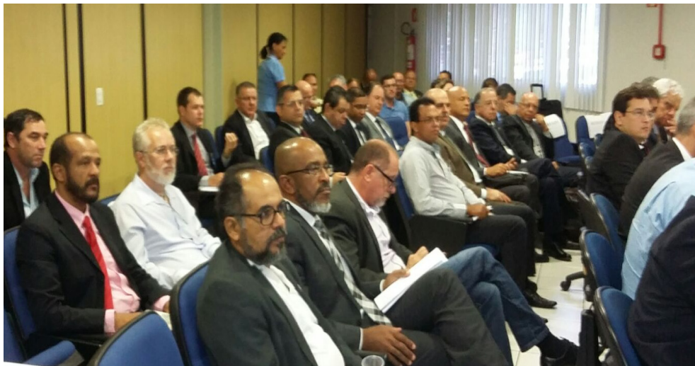
CNTV defendeu ainda que crimes contra vigilantes em serviço sejam caracterizados como hediondos

“A reunião de hoje demonstrou que a CCASP criou um espaço de debate de temas realmente interessantes para a categoria. Sempre que houver demandas traremos para discutir com os membros da Comissão com o objetivo de melhorar cada vez mais