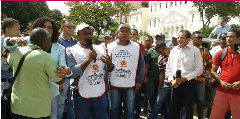
Trabalhadores realizaram protesto em frente ao Palácio do Leão

Na próxima quinta-feira (14), o Sindicato dos Vigilantes do estado do Maranhão (Sindvig/MA) participará de reunião com as diferentes secretarias do governo para tratar da situação dos mais de 5 mil trabalhadores que estão com os salários do mês de abril atrasados.