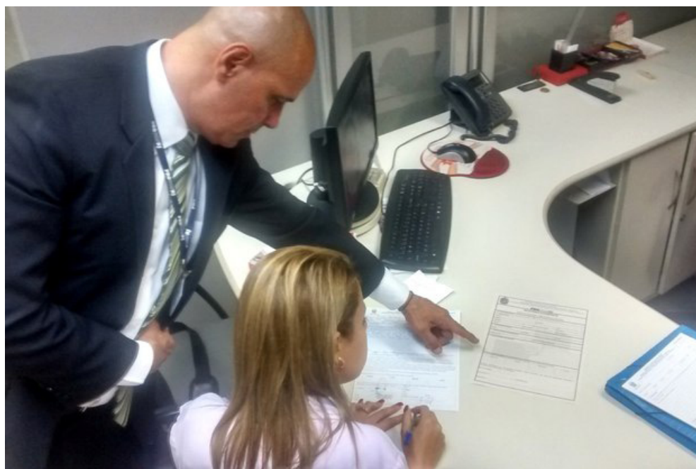
Fiscais autuaram agências bancárias no Centro

O centro do Rio de Janeiro foi o alvo na sexta-feira (22) da Operação Tio Patinhas do Procon Estadual, órgão ligado à Secretaria de Estado de Proteção e Defesa do Consumidor (Seprocon). A fiscalização autuou as